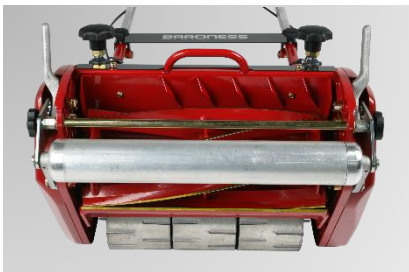
世界で認められた優れた切れ味のバロネスリールカッター（6枚刃）で、きれいな刈り上がりを実現します。6段階の高さ調整と簡易研磨ができる逆転スイッチ付です。