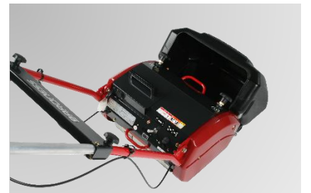
バッテリーを備えたコードレスタイプで機動性に優れます。本体フレームは軽量かつ丈夫なアルミ大キャスト製で、取り扱いやすく、運搬も楽々できます。